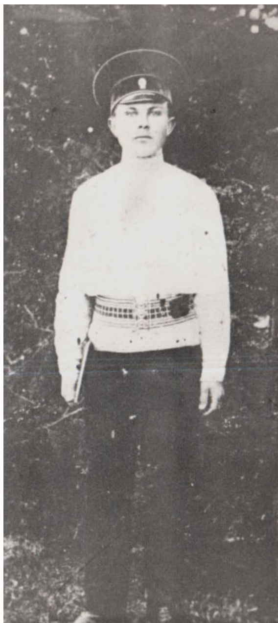
Фото начала XX века